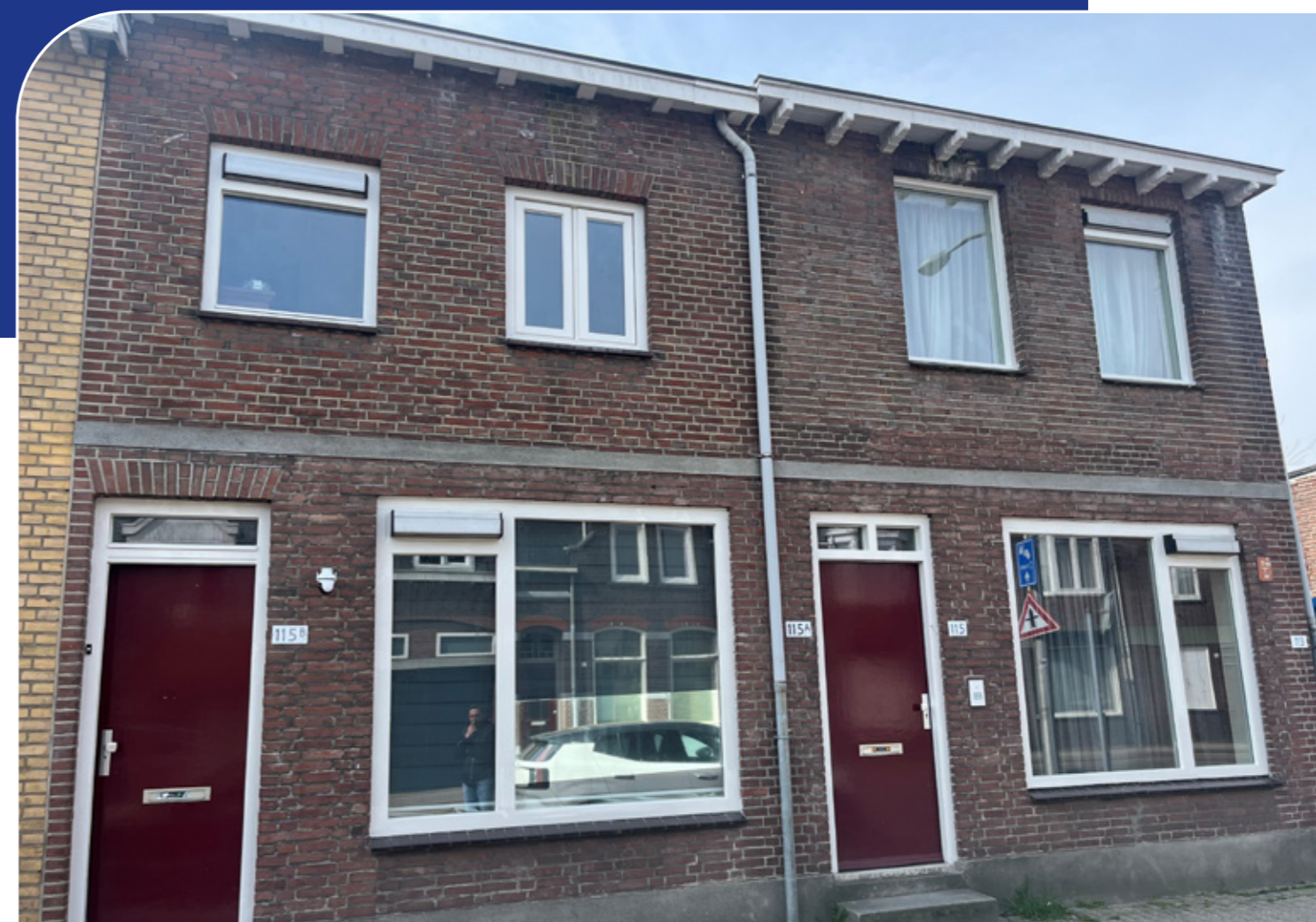
Broekhovenseweg 113, 113a, 115, 115a, 115b